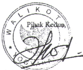
H. HARYADI SUYUTI

Pihak kedua akan melakukan supervisi yang diperlukan serta akan melakukan evaluasi terhadap capaian kinerja dari perjanjian ini dan mengambil tindakan yang diperlukan dalam rangka pemberian penghargaan dan sanksi.